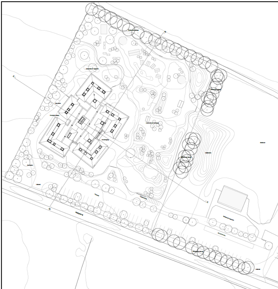
Kortudsnit 3: Situationsplan over daginstitution med legeplads og parkeringsområde fra ansøgningsmaterialet.