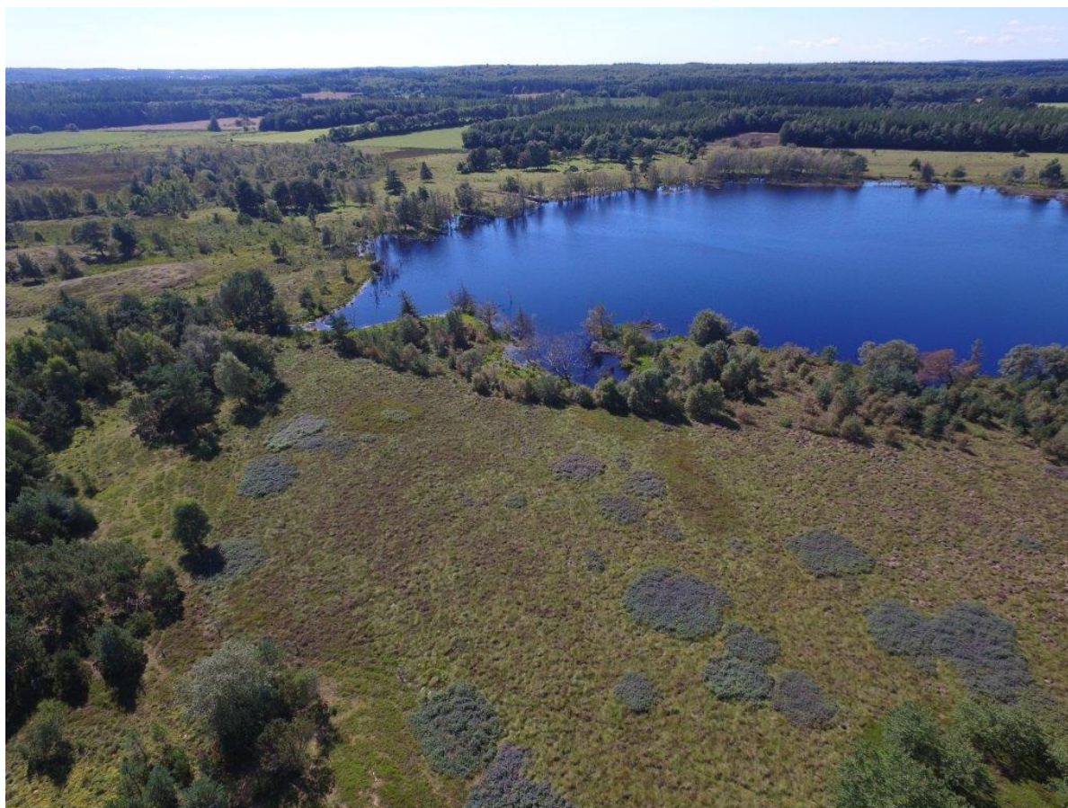
Stenholt Mose – den centrale sø

I 1. planperiode har kommunen været i dialog med lodsejerne i området. Primært for at oplyse ejere af plejekrævende arealer om plejemuligheder og dertilhørende plejeordninger. Der har også været kontakt til ejere med en igangværende plejeindsats for at sikre en videreførelse/ evt. forbedring af den eksisterende pleje.