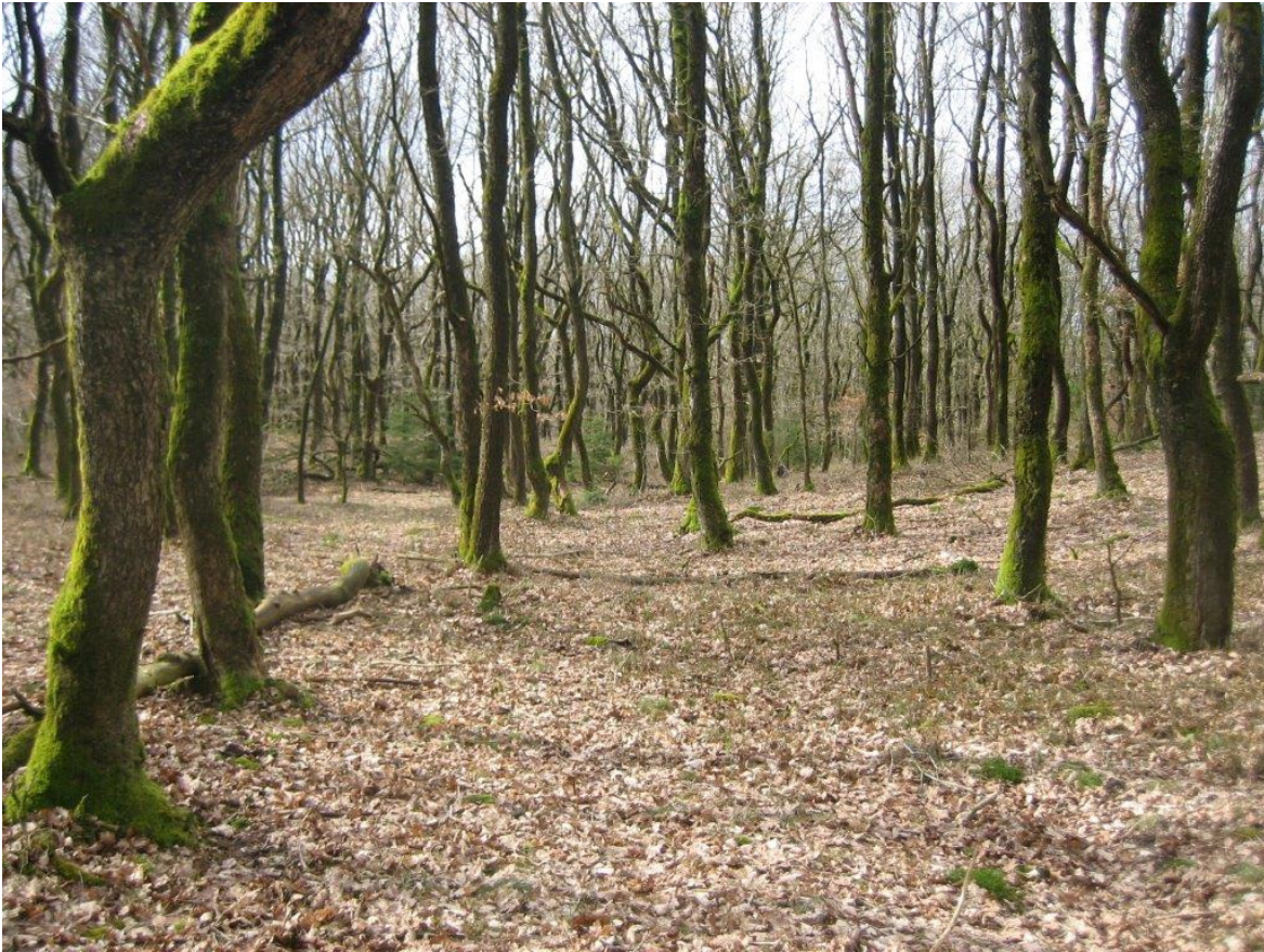
Krat af vinter-eg i Stenholt Skov