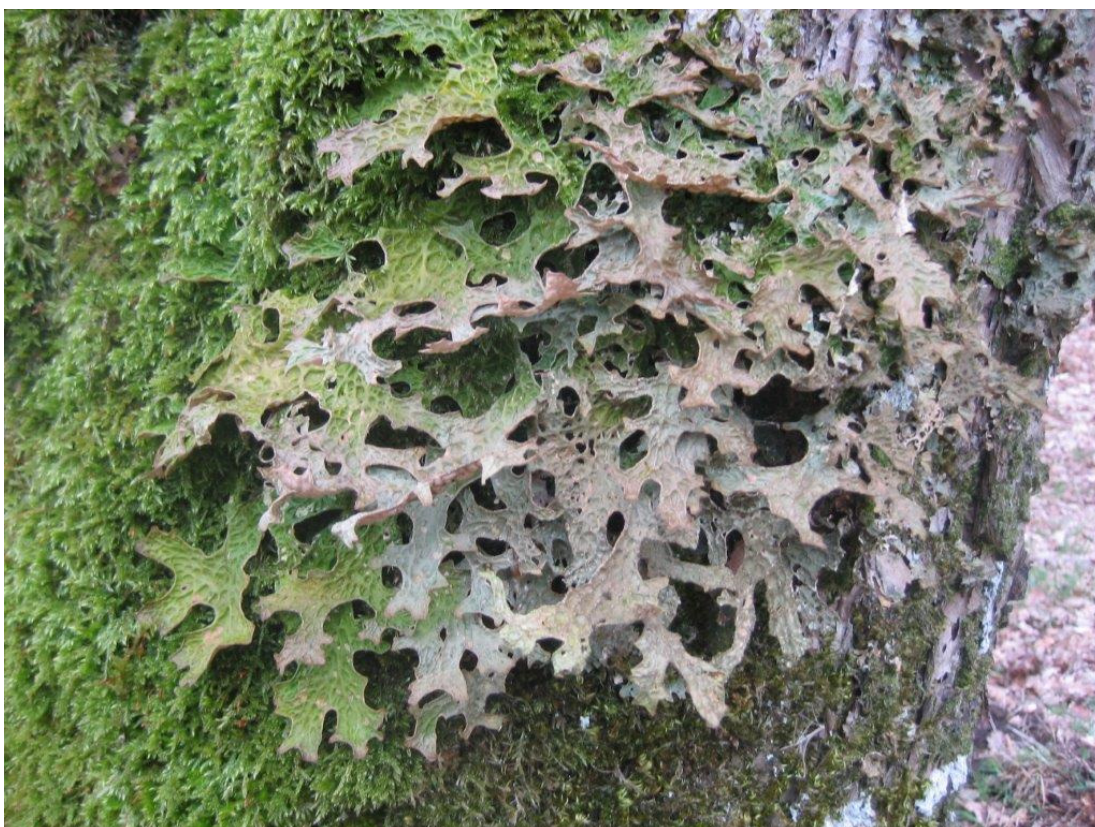
Lungelav på vinter-eg i Stenholt Skov