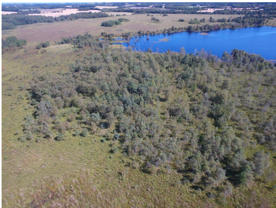
Skovbevokset tørvemose ved den centrale sø i Stenholt Mose