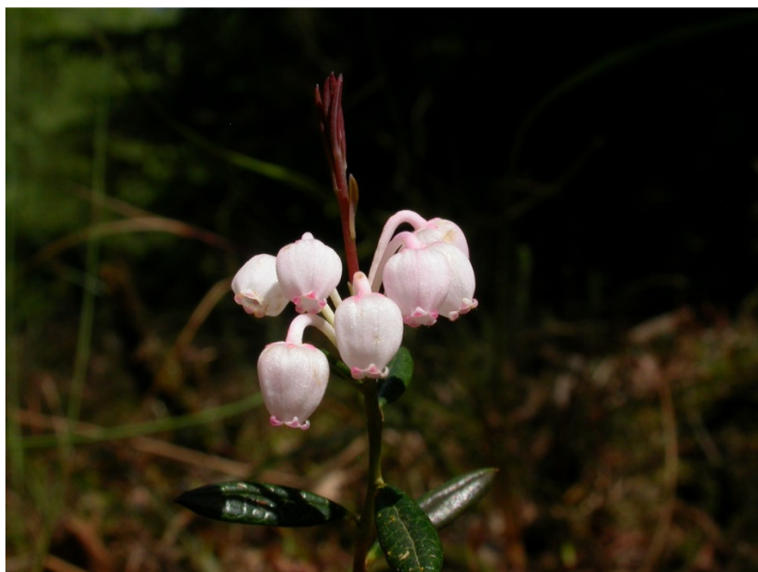
Rosmarinlyng fra Stenholt Mose