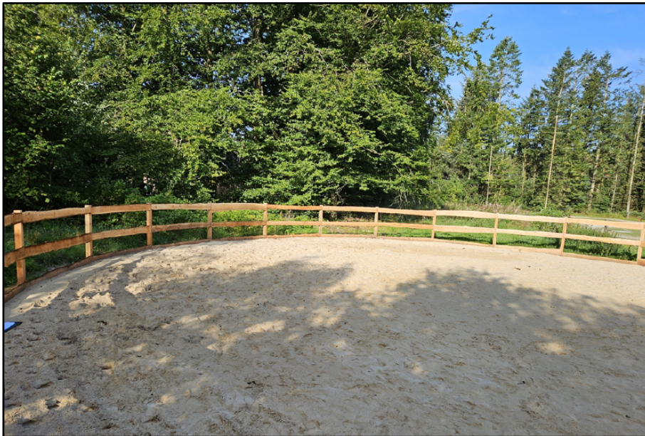
Foto: Illustration af ejendommens roundpen

Roundpennen er placeret ca. 25 meter østnordøst for ejendommens beboelse.