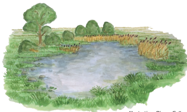
Illustration: Bjarne Golles

Vidste du, at padder kan trække vejret på 4 forskellige måder? Haletudserne/larverne ånder ved hjælp af gæller, mens de voksne padder kan ånde vha. lunger, mundhule og igennem huden!