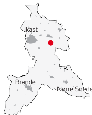
Områdets placering i kommunen.

Begge arealer er i dag beliggende i landzone og anvendes til landbrugsdrift.