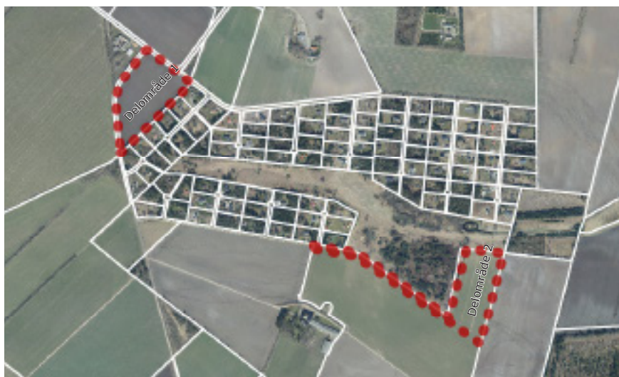
Luftfoto af området. Planområderne er markeret med en stipt, rød streg.