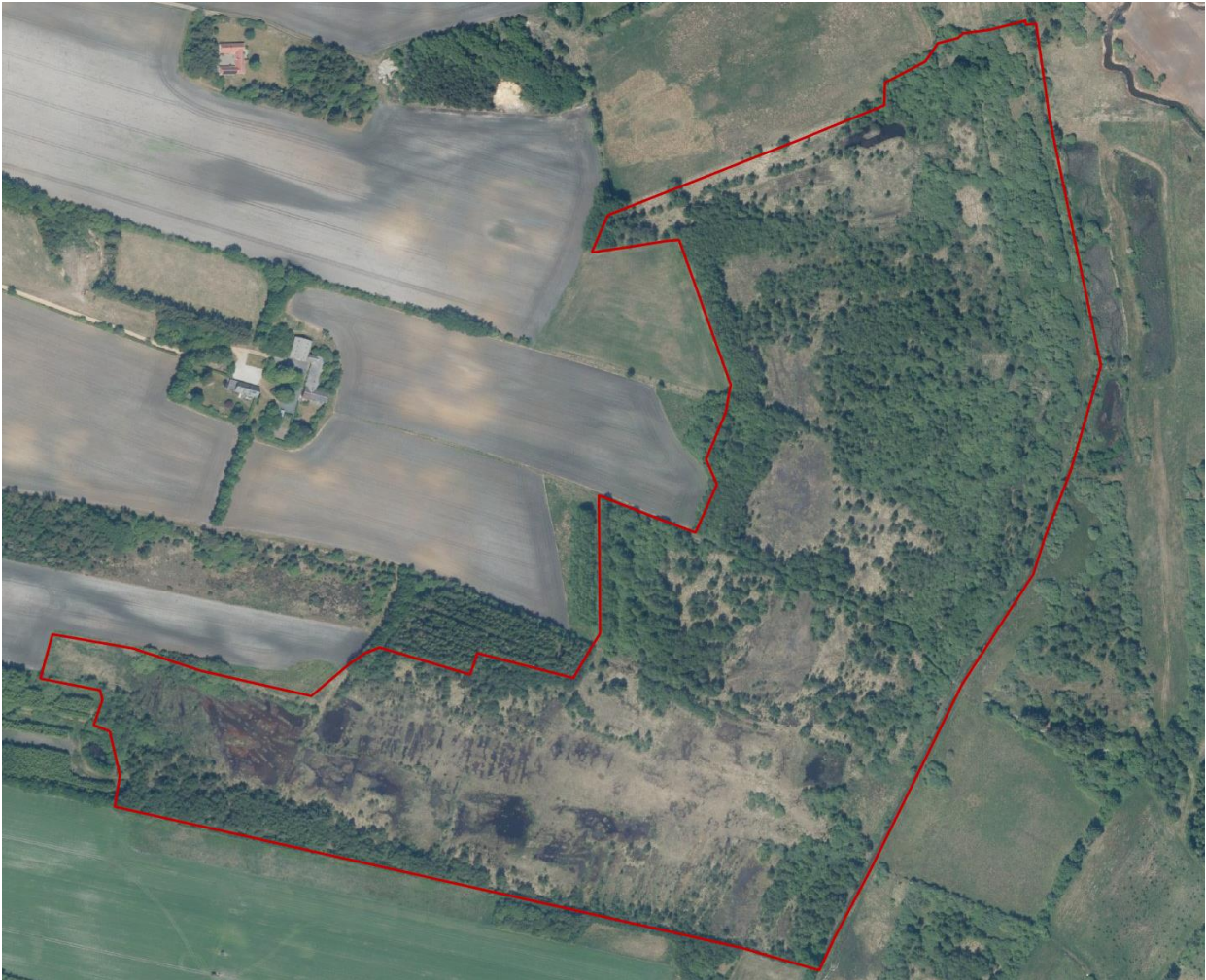
Figur 2: Kortet viser Natura 2000-området Mose ved Karstoft Å. Hele Natura 2000-området er privatejet og ligger i Ikast-Brande Kommune.