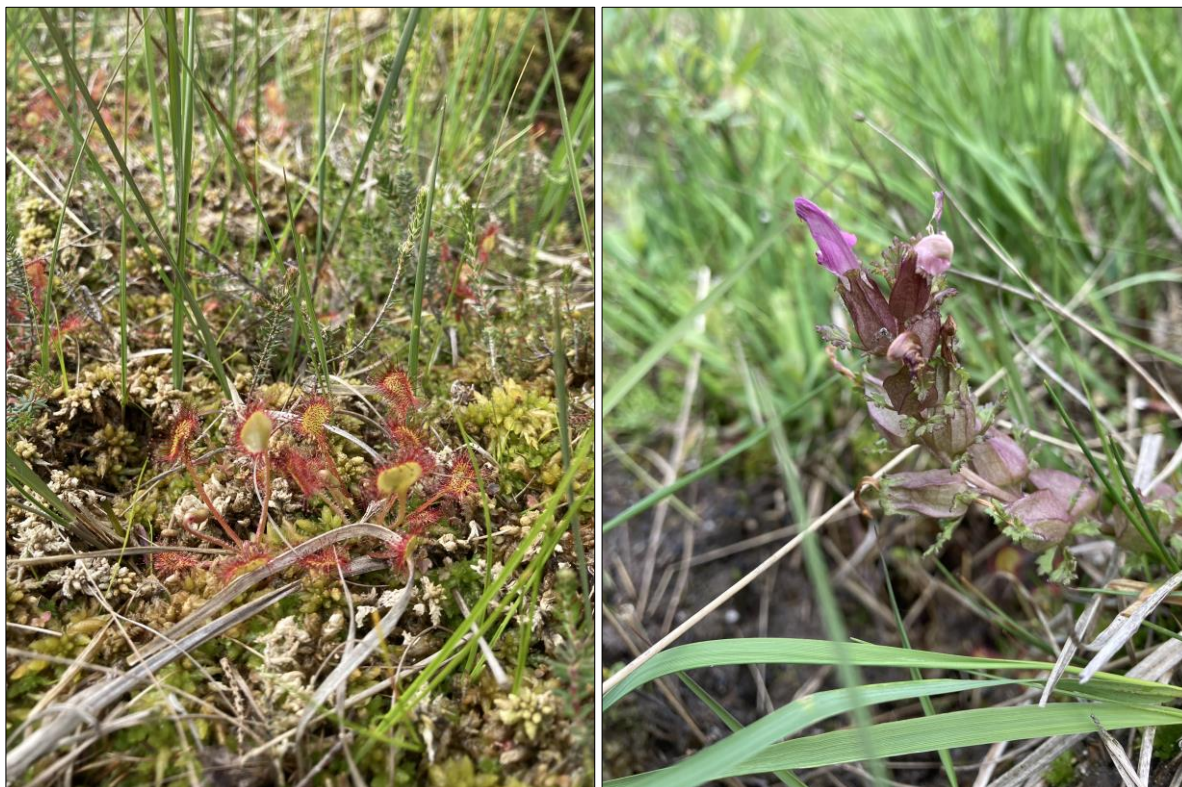
Figur 1: Rundbladet Soldug ( Drosera rotundifolia ) og Mose-Troldurt ( Pedicularis sylvatica ) i mose ved Karstoft Å.

Generelt, så udføres indsatserne både på offentlige og private arealer i området. Alle arealer i dette område er dog privatejede. Projekter på private lodsejeres arealer gennemføres i videst muligt omfang gennem frivillige aftaler. Der findes blandt andet en række understøttende tilskudsordninger, som kan søges gennem Landbrugsstyrelsen og Miljøstyrelsen, samt midler til Life-projekter som medfinansieres af EU.