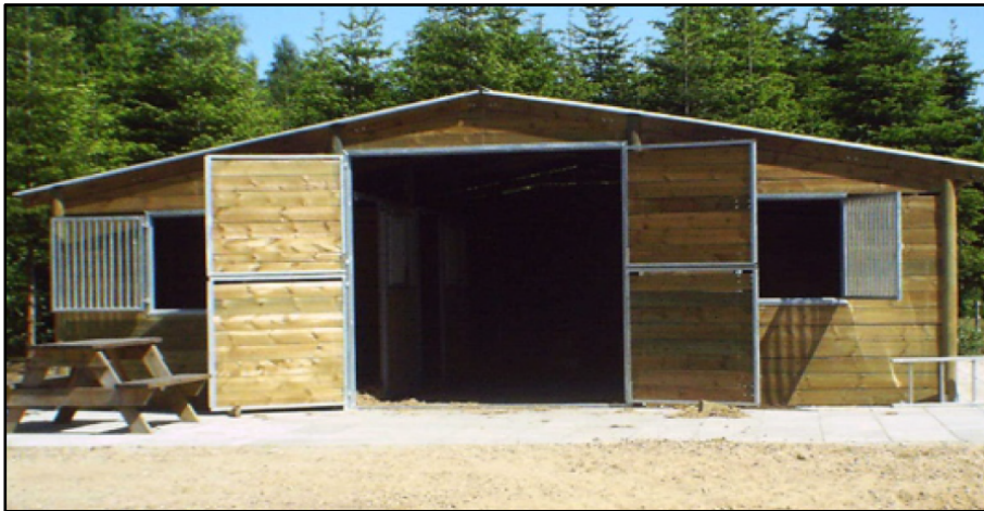
Illustration fra ansøgningsmaterialet.

Ridebanen måler ca. 25 meter X 62 meter, i alt ca. 1.555 m 2 , og underlaget består af sand og muslingeskaller. Der er ca. 30 meter mellem hestestalden og ridebanen, som også er placeret i området med hestefolde. Hele området med hestefolde – og stald og ridebane – er omgivet af beplantning og læbælter.