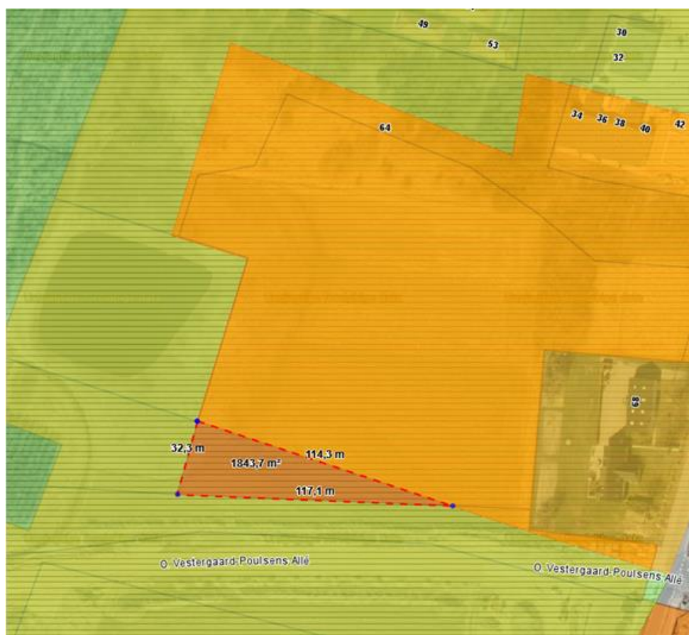
Kort bilagt kommunens ansøgning