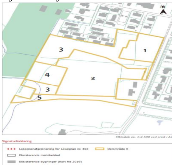
Kort fra lokalplan 403