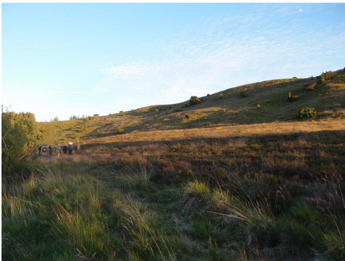
Aftensol på nordsiden af Bøgelund Banke ved midsommer