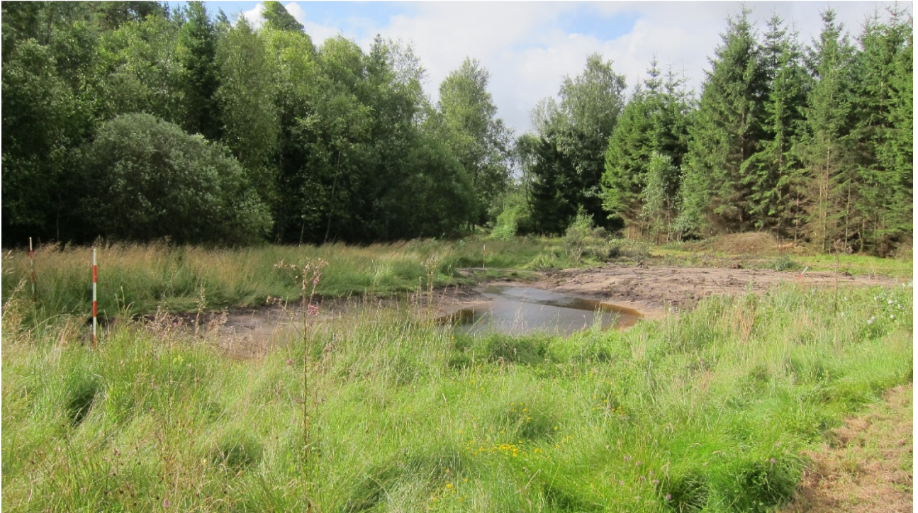
Nyetableret vandhul til stor vandsalamander