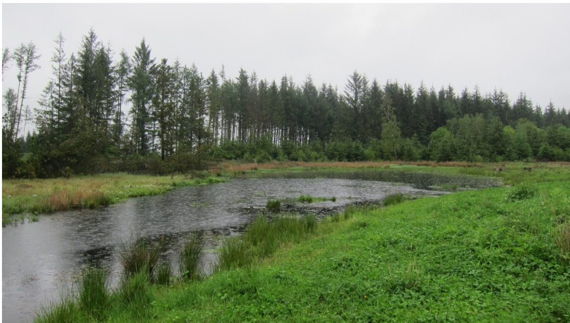
Oprensset vandhul ved St. Bredlundvej

Der vil i indsatserne være særligt fokus på de naturtyper, der har en væsentlig forekomst i området, og som er i tilbagegang