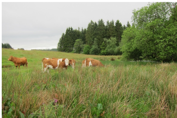
Afgræsning ved Torup Sø