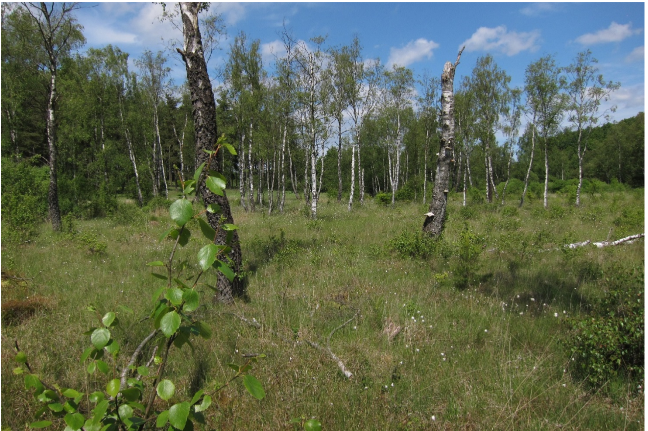
Skovbevokset tørvemose ved Boest Bæk