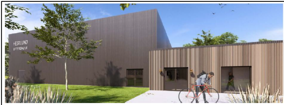
Illustration fra ansøgningsmaterialet

Jordvolden bliver i alt ca. 50 meter lang, og får i det nordvestlige hjørne en maksimal højde på 130 cm, mens volden mod syd og i det sydvestlige hjørne får en højde på maksimalt 170 cm. I det sydøstlige hjørne bliver volden maksimalt 75 cm høj.