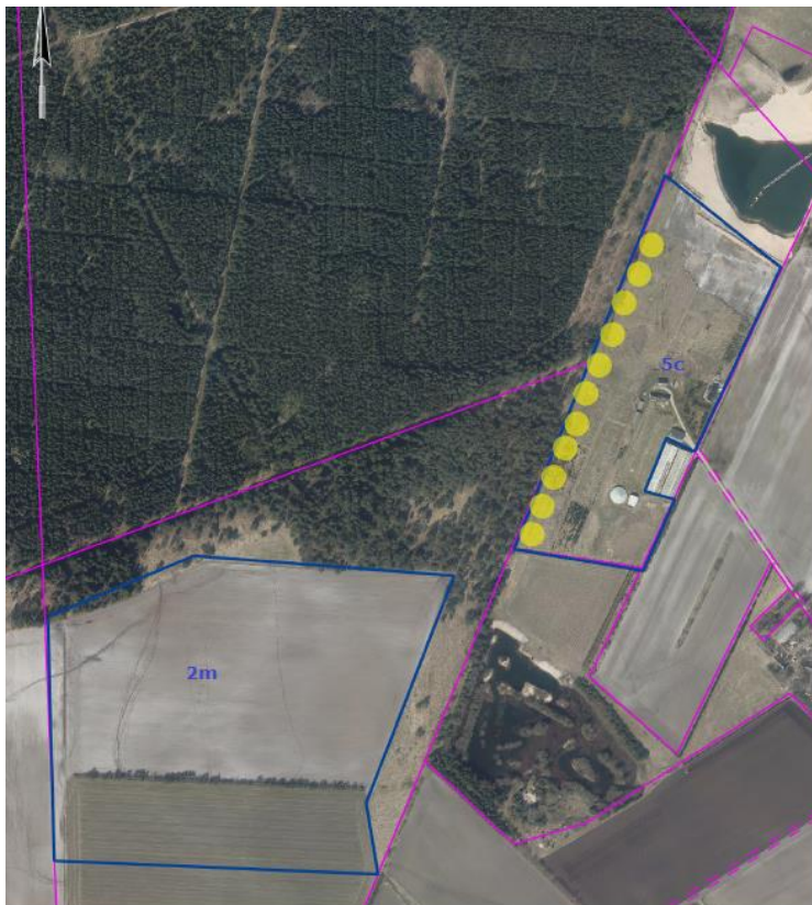
Figur 1: Skitsering af placeringen af de 11 nye moniteringsboringer (gule prikker). De blå streger angiver det ansøgte graveområde, og de pink streger angiver matrikelgrænser.

Moniteringsprogrammet skal kortlægge en eventuel påvirkning af grundvandsstanden, når der indvindes råstoffer. Ved at følge udviklingen i grundvandsstanden vil det være muligt at standse råstofindvindingen i tide, hvis det mod forventning skulle vise sig, at råstofindvindingen påvirker omgivelserne.