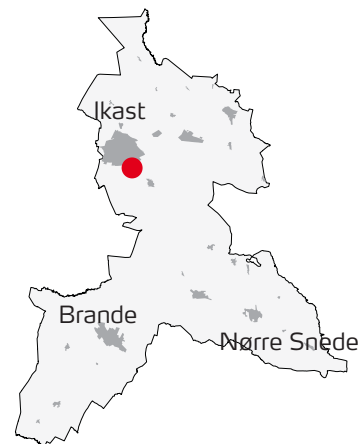
Områdets placering i kommunen.

Der er tale om en væsentlig ændring i arealanvendelsen ved inddragelse af arealet til erhvervsområde i byzone. Forslagene til kommuneplantillæg nr. 26 og lokalplan nr. 446 skal derfor ledsages af en miljørapport, der omfatter en miljøvurdering af planforslagenes eventuelle væsentlige miljøpåvirkninger.